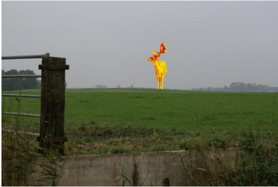
Het Gouden Hert eerste impressie