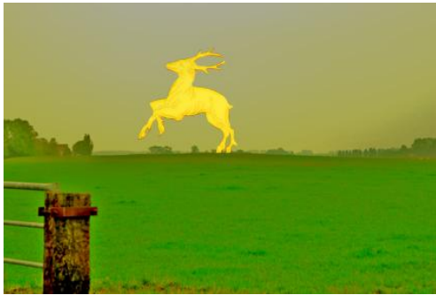
Het Gouden Hert tweede impressie op basis van het wapen van Reekamp